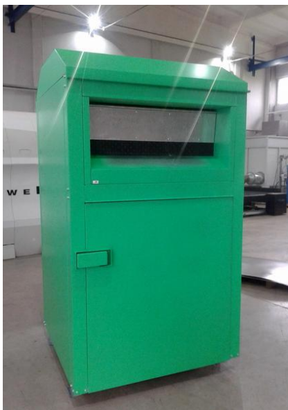
Рис.1 – Общий вид контейнера

Объем контейнера – 2,5м 3 . Изготовлен из оцинкованной стали толщиной 1,2 мм.